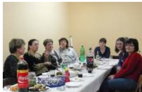
Kobiety z Wierzbowa wspólnie obchodzą swój uroczystość

Wierzbowo posiada ponad 100-letnią tradycję, chociaż różniła się w czasach starożytnych, zwłaszcza w Grecji i Rzymie, kolebkach europejskiej kultury. Bazylika ma tak bogatą historię naturalnym jest, w jak wielu miejscach staraliśmy się dobrze uczcić ten dzień. Nie inaczej było także w Wierzbowie, które przy okazji w ten sposób stara się zrobić użytek ze swojej wietlicy i tak jak wczoraj zorganizowano bal karnawałowy tak teraz odbyły się tam obchody Dnia Kobiet. Dla wszystkich przybyłych dam była to przede wszystkim chwila oderwania się od codziennej rutyny, aby przy kawie i ciastkach spędzić przyjemnie ten czas na rozmowie i wspólnej zabawie, pozwalając chwilę relaksu i odpoczynku. A piękna, słoneczna pogoda tylko wzbogaciła przyjazną atmosferę. Wszystkie panie bardzo dobrze się bawiły, dzięki czemu miały kolejną miłą chwilę, do której przyjemnie będzie wrócić.