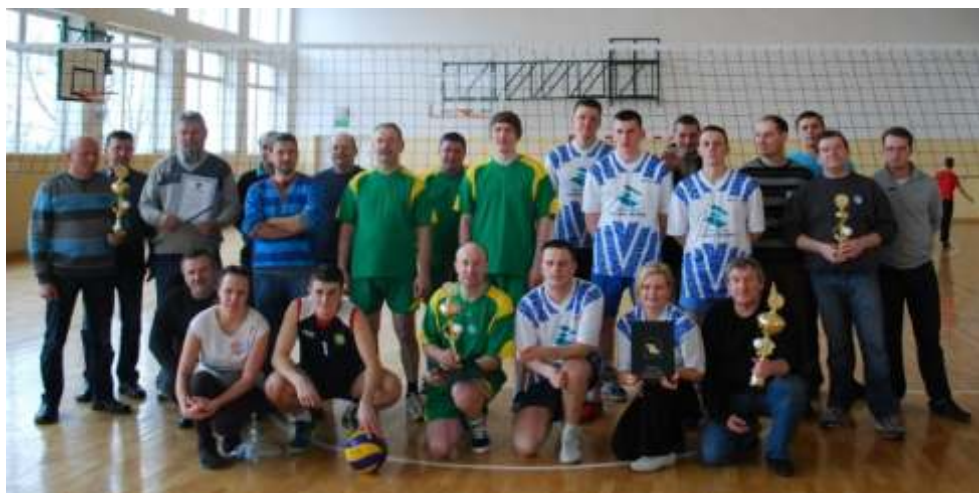
Siatkarze tu po zakończonym turnieju