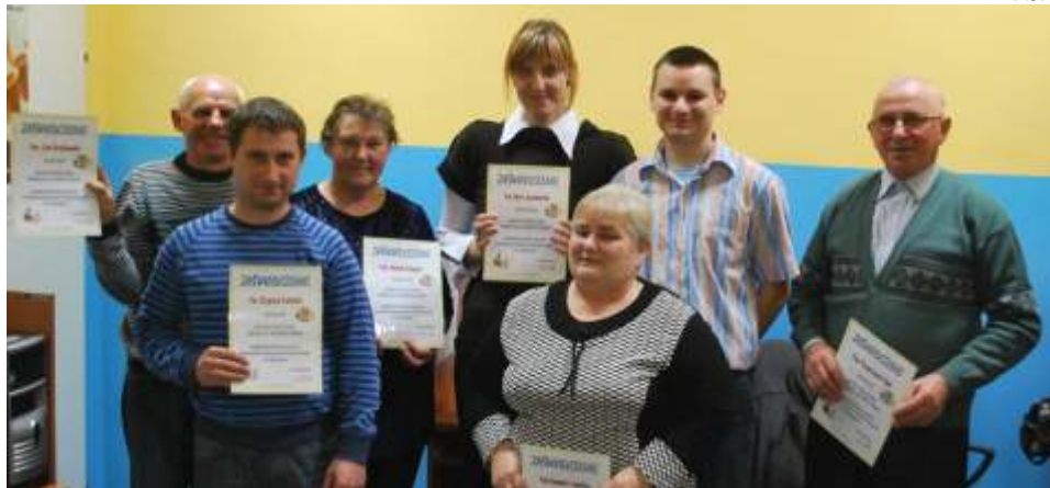
Uczestnicy z dumą prezentowali otrzymane za wyłączenia