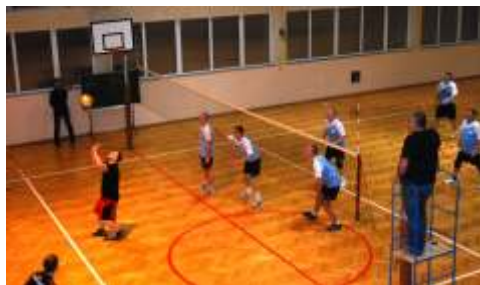
Kropelka podczas jednego ze spotkań

W walce o finał lisewska drużyna uległa ekipie ze Stolna przegrywając oba spotkania. Kropelka ma jednak cały czas szansę na bardzo dobre miejsce, ponieważ został im mecz o 3. lokatę, który rozegrają ekipy z Paparzyną.