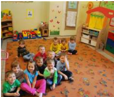
Dzieci ze wietlicy rodowiskowej w Lisewie