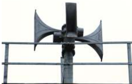
Nowa syrena strażacka

W przyszłości planuje się unowocześnienie systemu alarmowania poprzez udostępnienie nowych funkcji syreny (np. komunikaty głosowe, system SMS powiadamiający mieszkańców). Jest to jednak uzależnione od środków, jakie uda się pozyskać OSP Lisewo na ten cel.