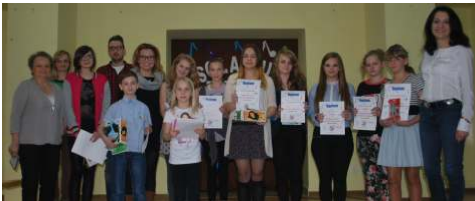
Młodzi artyści wraz z jury i organizatorami