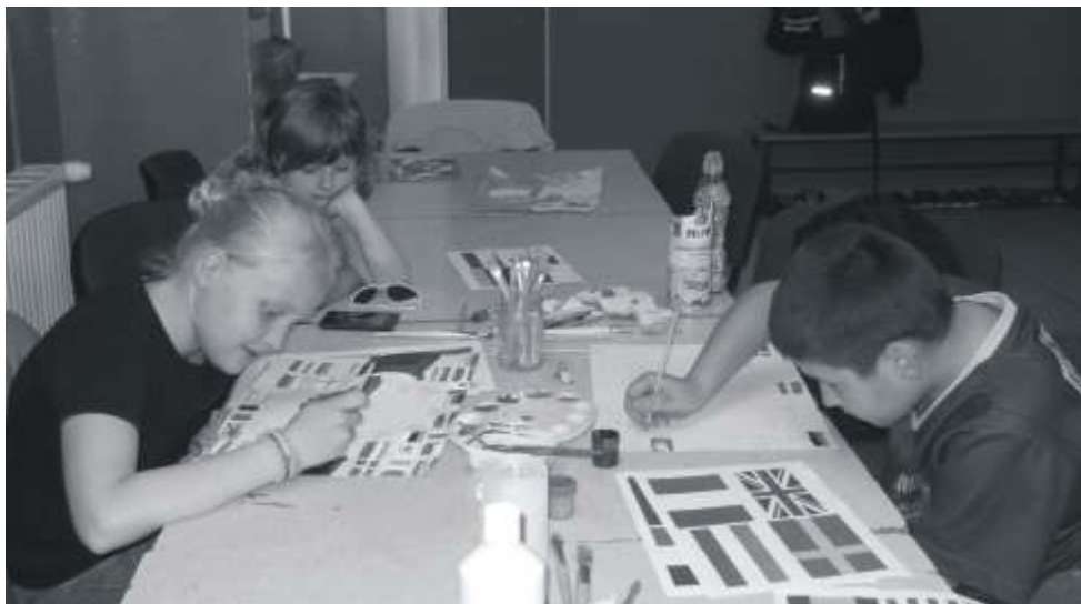
Dzieci ze wietlicy w trakcie pracy