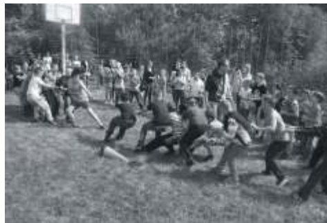
Sportowcy w czasie jednej z konkurencji

Dnia 30 maja 2014 roku zorganizowana została gminna edycja tego wydarzenia dla wszystkich dzieci z naszych wiosek. Organizatorzy transportem na teren okolicznie zapewnili wychowankom klas I-III szkół podstawowych, ale udział w zabawie mógł brać każdy, kto tego dnia odwiedził miejsce zabawy, a więc gospodarstwo agroturystyczne „Arkadia”.