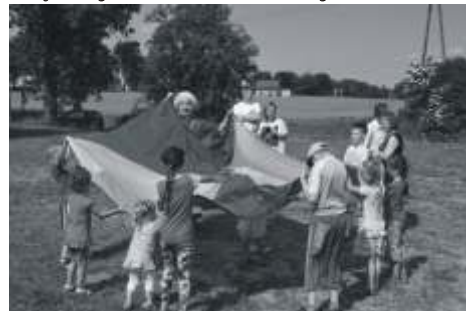
Dzieci podczas jednej z atrakcji swojego wiośni

Pogoda od początku czerwca posiadała sprzyjające warunki dlatego warto było z niej korzystać. Nie inaczej zrobiono w Piętkowie, które swój Mały Dzień Dziecka zorganizowało w sobotę 7 czerwca 2014 roku. Organizatorzy na ten wyjątkowy dzień przygotowali szereg atrakcji, aby każde dziecko mogło spędzić ten czas na aktywnej zabawie w miłej atmosferze.