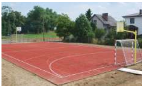
Ukończony boisko wielofunkcyjne

W ostatnim czasie, na terenie Lisewa realizowane były dwie inwestycje o przeznaczeniu czysto sportowym. Prace miały na celu remont trybun wraz z montażem piłkochwytywów na miejscowym stadionie, a także wykonanie boiska wielofunkcyjnego wraz z pełnym wyposażeniem, umożliwiającego granie w siatkówkę, koszykówkę, tenis ziemny i inne sporty. Firmą zajmującą się pracami budowlanymi była Spółdzielnia Produkcji Rolnej, Zakład Remontowo-Budowlany, znajdujący się w Osnowie, który w ogłoszonym przetargu uzyskał najlepszy wynik, prezentując najkorzystniejszą ofertę. Warto tutaj nadmienić, że w ramach realizacji owego projektu Gmina Lisewo zdołała zapewnić także środki na remont wiejskich wietlic w miejscowościach Bartlewo, Błachta i Strucfo, a także