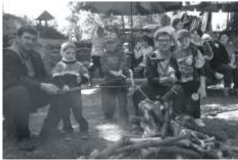
Uczestnicy zabaw przy wspólnym ognisku