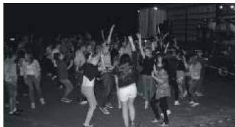
Uczestnicy wspólnej zabawy