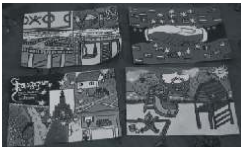
Kilka z prac wychowanków wietlicy

Z ko cem maja uczestniczyli my tak e w Gminnym Dniu Dziecka