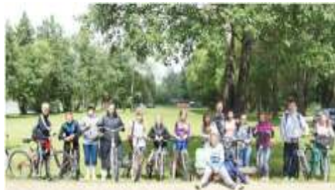
Uczestnicy podczas odpoczynku

W ramach akcji „Weekend na sportowo” zorganizowali my rajd rowerowy do Przydworza. Wycieczki rowerowe cieszą się w naszej szkole dużym zainteresowaniem dlatego chętnych nie brakuje. W sportowy weekend zaangażowali się również rodzice