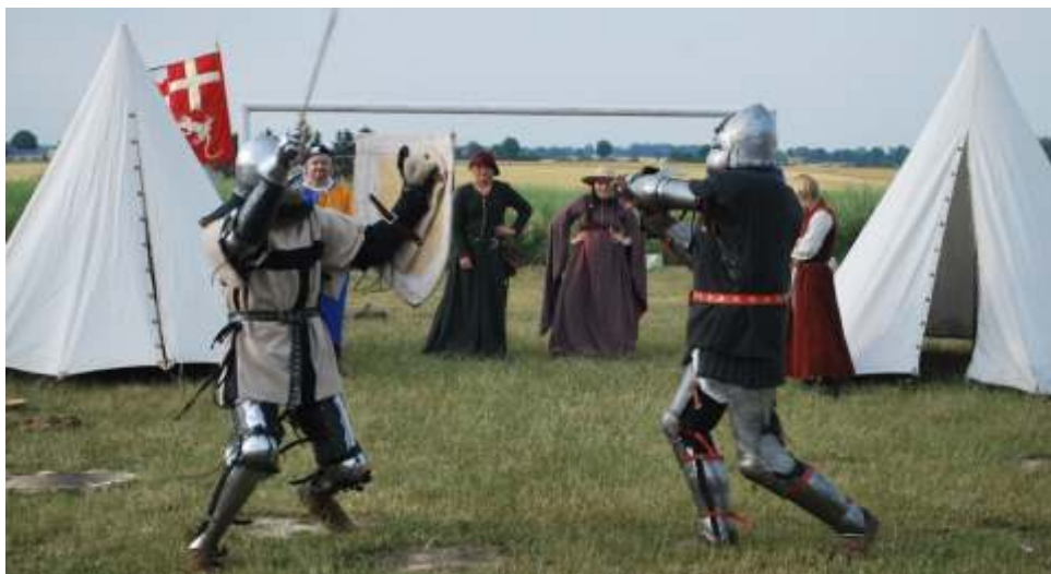
Pokaz walk rycerskich