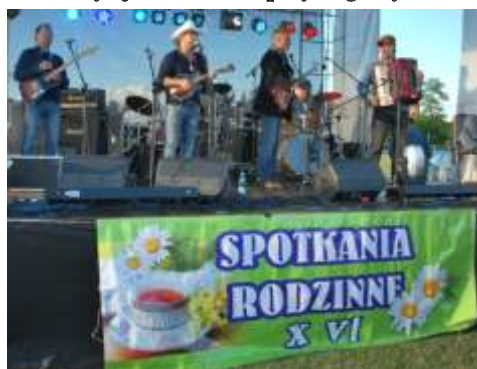
Jeden z zaproszonych zespołów