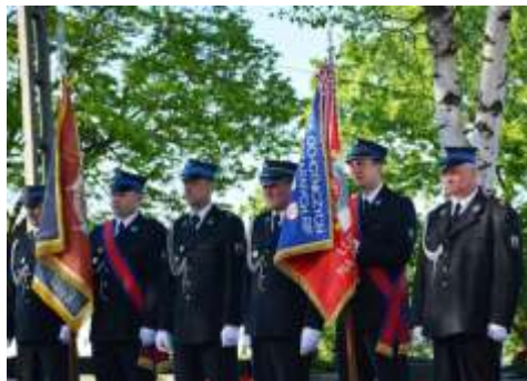
Bra Strażacka podczas apelu przed remizą w Lisewie