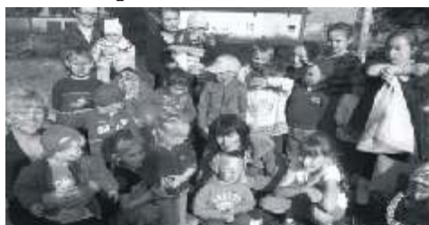
Pamiłkowe zdjęcie z Kornatowa