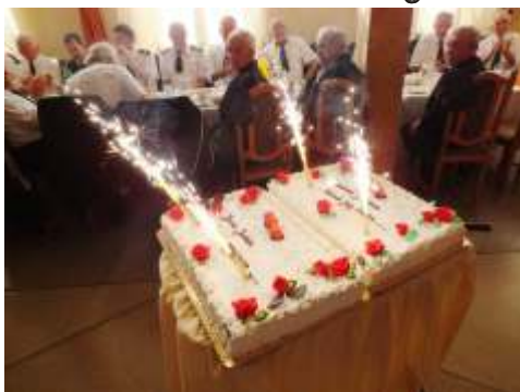
Tort przygotowany dla weteranów