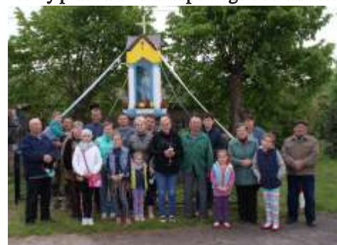
Mieszkańcy Strucfonia zebrani przed kapliczką