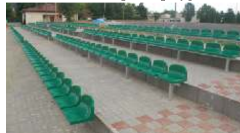
Nowe trybuny na stadionie w Lisewie

montaż urządzeń na placu zabaw w miejscowości Krajcin, co w ostatecznym bilansie prezentuje jeden projekt obejmujący prace na kilku obiektach jednocześnie. Ogółem prace związane z całym tym przedsięwzięciem zostały zrealizowane do 30 czerwca 2014 roku, dzięki czemu w pełni przygotowane