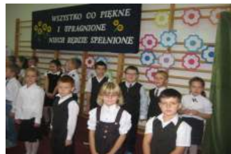
Pierwszoklasi ci podczas pasowania

wydawania polece i komend obecnym na hali psom. Bardzo wa nym dniem dla uczniów klasy I i ich rodziców był dzie 14 pa dziernika 2014 roku.