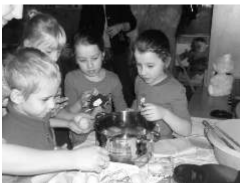
Dzieci z niewielką pomocą swoich rodziców robiły gofry

w naszej maleńkiej wietlicy. Było swojsko, ciasno, gwarno i rado nie ale bezpiecznie, a pachniało tak, że nawet misie cichutko mruczały z zadowolenia. Dzieci, misie oraz