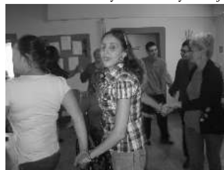
Wszyscy mieli bardzo dużo energii oraz chcieli do zabawy.