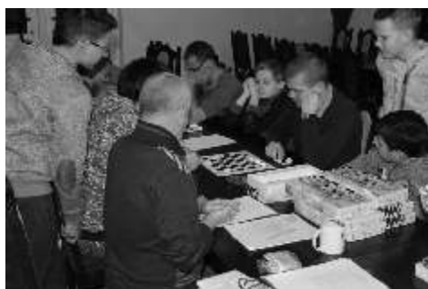
Zacięta „walka” graczy ciekawiła wszystkich uczestników

27.11.2014 r. w Sali sesyjnej odbył się gminny turniej warcabów. Nie było to pierwsze spotkanie z warcabami w naszej