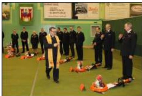
wi cenie nowych rozpieraczy

Pomorskiego udało nam si w tym roku wzbogadzi o ratowniczy rozpieracz kolumnowy. Rozpieracz otrzymali mi dzi ki pozyskanemu przez OSP Lisewo dofinansowaniu z Oddziału Wojewódzkiego ZOSP RP, które wyniosło 11.197,44 zł (80%) oraz wkładowi własnemu OSP Lisewo tj. dotacji z Gminy Lisewo w wysoko ci 2.799,36 zł (20%). Całe