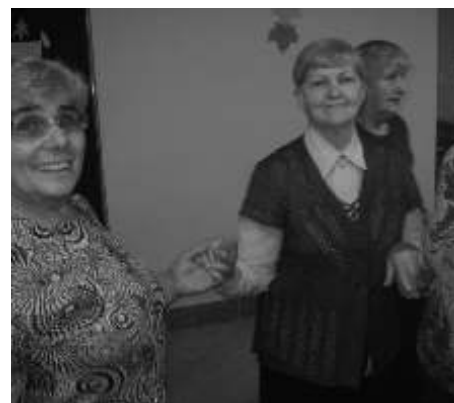
Nikomu nie brakowało energii.

atmosfery. Obserwuj c rozbawion grup odnie li my wra enie jakby wszystkim ubył o lat. Zabawa była fantastyczna. Mo e powtórzymy to za rok?