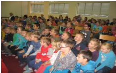
Dzieci z zafascynowaniem ogl dają przedstawienie teatralne

wiatowej. Pó niej był spacer po lesie i atrakcje przygotowane przez Koło Łowieckie „Hubert” w Klamrach. Uczniowie ogl dali pa niki, plantacj topinamburu, poro a i wysłuchali ciekawych opowie ci o lesie i jego mieszkach. Wielk atrakcj była mo liwo obserwacji sokołów i psów my liwskich. W chacie my liwskiej był pocz stunek z kiełbasek pieczonych na ognisku oraz napoje i słodycze. Uczniowie klas starszych w ramach zaj przyrodniczych szkolnego koła miło ników przyrody brali udział w rajdzie pieszym na orientacj (19 wrze nia 2014 r.) na terenie miejscowo ci: Wierzbowo, Wabcz, Linowiec. Kolejny to rajd rowerowy do lasu w Wabczu w dniu 7 pa dziernika 2014 r. Uczniowie musieli wykaza si umiej tno ci czytania mapy, wyznaczania kierunków, prowadzenia obserwacji przyrodniczych w terenie oraz rozpoznawania gatunków drzew i krzewów