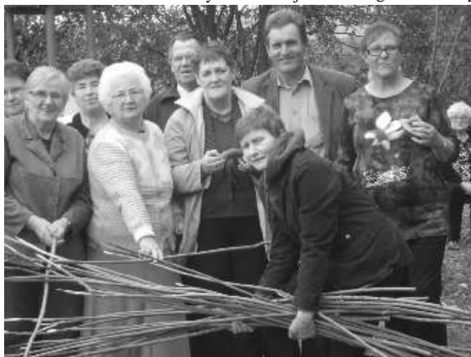
Wszyscy sprawnie pomagali przy organizacji ogniska