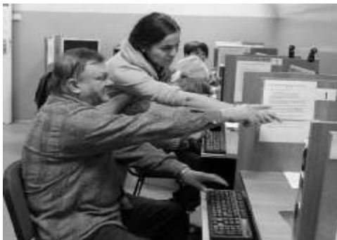
Kursanci z zacięciem zdobywali wiedzę

W dniach 13 - 23 października w Gminnym Centrum Informacji odbył się kolejny bezpłatny kurs komputerowy. Uczestnicy przez dwie godziny dziennie poznawali podstawy obsługi komputera. Na samym początku szkolenia każdy z kursantów poznał zasady obowiązujące przy pracy ze sprzętem komputerowym. Następnie uczestnicy poznali ogólną budowę komputera i systemu operacyjnego. Kolejne dni przyniosły prace z edytorem tekstu oraz Internetem. Uczestnicy z zacięciem poznawali możliwości jakie może dawać komputer. Niewątpliwie najciekawsze dla nich było „serfowanie” po Internecie. Słuchaczom nie brzydziej obce założenie konta na poczcie elektronicznej, sprawdzenie rozkładu jazdy PKS