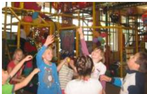
Wycieczka do Mega Hoplandu wywołała wiele uśmiechów i rado ci

W dniu 1 pa dziernika 2014 r. uczniowie klasy I, II i III wyjechali do Centrum Rozrywki dla