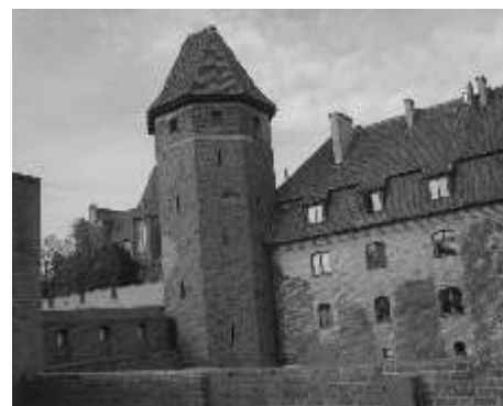
Zabytkowa twierdza w Malborku

W dniu, 19 października odbyła się wycieczka do jednego z najcenniejszych zabytków polskiej architektury - Malborka, organizowana przez Gminne Centrum Informacji. Frekwencja była zachwycająca, wszyscy punktualnie o 9:00 rano stawili się na umówione wcześniej miejsce. Pierwszym przystankiem w Malborku był Zamek Krzyżacki. Pod „dowództwem” przewodnika zwiedzaliśmy cały dziedziniec, słuchaliśmy różnych, ciekawych historii związanych z tym miejscem.