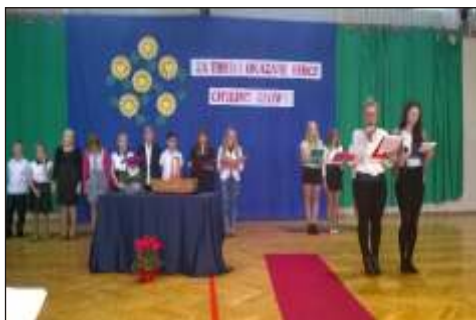
Uroczysty apel dedykowany nauczycielom

Na tym nie koniec. Do grona braci uczniowskiej należało przyjąć uczniów klas pierwszych i w dalszej części tego uroczystego dnia byli my