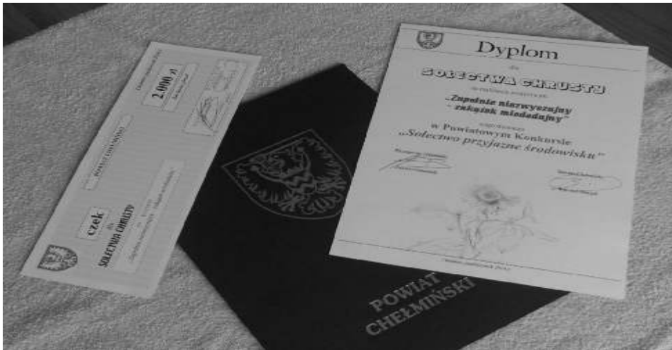
Zasłona nagroda Sołectwa Chrusty

jest ogromna, a to świadczy nie tylko o wysokiej klasie rolniczego rzemiosła, ale i o zwykłej ludzkiej przyzwoitości. Ciekawym elementem projektu było też opracowanie „przypominajki”, w której zostały znalezione wierszowana regułka o pszczołkach i wykaz roślin miododajnych, które z powodzeniem można stosować w polach lub ogrodach lub spotkać jako dziko rosnące. Projekt wsi Chrusty zyskał aprobatę konkursowego jury i został nagrodzony czekiem o wartości 2000 zł. Uroczyste wręczenie czeków i dyplomów odbyło się w sali Starostwa Powiatowego