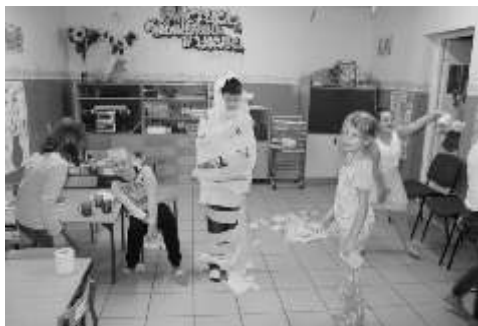
Dzieci radośnie i aktywnie uczestniczyły w zabawach

Dnia 26.11.2014 r. w wietlicy rodowiskowej w Lisewie odbyła się zabawa andrzejkowa. Uczestniczyli w niej wszyscy dzieci z wietlicy rodowiskowej wraz z opiekunami. Zabawa rozpoczęła się o godzinie 14:00, kiedy wszystkie dzieci ukończyły zajęcia w szkole. Andrzejki rozpoczęły się od tańca i wróżenia. Ogromne wrażenie na dzieciach zrobiły wyniki wróżby. Podczas zabawy mogli zobaczyć