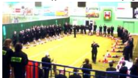
W obecno ci władz regionu, powiatów i gmin nast pło uroczyste przekazanie sprz tu jednostce

udanego przedsi wzi cia. Poprzez pozyskiwanie najnowocze niejszego sprz tu podnosi si poziom bezpiecze stwa na terenie gminy Lisewo, wzrasta gotowo bojowa i poziom wyposa enia jednostki, a tak e profesjonalizm podejmowanych działań .