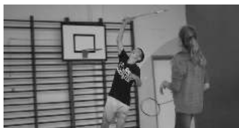
Na twarzach uczestników można było zauważyć wielkie skupienie i determinację.

O tym, że jest to dyscyplina trudna, wymagająca wietnej kondycji, zwinności i refleksu, przekonali się uczestnicy turnieju, który odbył się 23.09.2014 r. w sali gimnastycznej SP w Lisewie. Turniej miał charakter otwarty, stąd też brali w nim wspólnie udział zawodnicy obu płci i w różnym wieku. Zawody rozpoczęły się od losowania