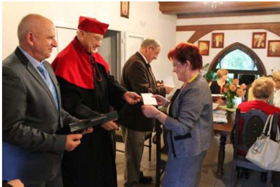
Władze wr czaj indeksy uczestnikom UTW

Uniwersytet cieszy si ogromn popularno ci i zainteresowaniem. Ju po oficjalnym rozpocz ciu roku akademickiego zgłosiło si kolejnych 5 osób. Aktualnie jest