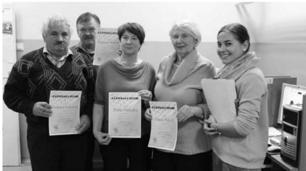
Wszyscy uczestnicy otrzymali za świadectwa ukończenia kursu

czy PKP, sprawdzenie ważnych informacji czy korzystanie z najpopularniejszych wyszukiwarek internetowych. Na koniec kursu każdy z uczestników otrzymał pamiątkowe zaświadczanie ukończenia szkolenia.