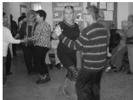
Pracownicy ZAZ'u również w wesołych humorach - pochłonili zabawę.

obejrze pomieszczenia, w którym pracują osoby tam zatrudnione. Potem sami pracowaliśmy naszym zadaniem było wykonanie sałatek. Do współpracy z nami włączyły się szybko panie - pracownicy zakładu. Po skończonej pracy wszyscy razem zjadaliśmy sałatki i nie tylko. Była to wspólna zabawa taneczna. Serdecznie dziękujemy za to przedpołudnie spędzone w miłej