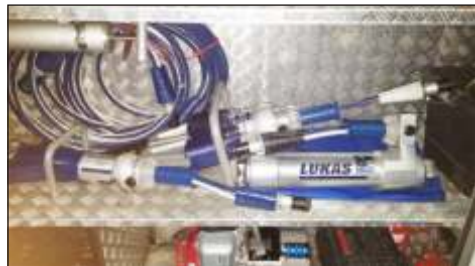
Nowy rozpieracz kolumnowy

przedsi wzi cie zamkn ło si kwot 13.996,80 zł. Uroczysto przekazania sprz tu jednostce odbyła si w dniu 7 listopada br. w Solcu Kujawskim w obecno ci władz regionu, powiatów i gmin. Rozpieracze kolumnowe s niezast pione w czasie uwalniania uszkodzonych w wypadkach drogowych, katastrofach kolejowych, czy po zawaleniu si budynków lub w sytuacji kl ski ywiolowej. Ogromna siła rozpierania, przy jednocze nie niewielkich rozmiarach, to główne zalety tego urz dzenia. B dzie on wietnym uzupełnieniem posiadanego przez nas agregatu hydraulicznego i no yc. To ju trzeci etap projektu organizowanego przez Oddział Wojewódzki Zwi zku Ochotniczych Stra y Po arnych RP w Toruniu. Lisewscy druhowie nie kryj zadowolenia z kolejnego