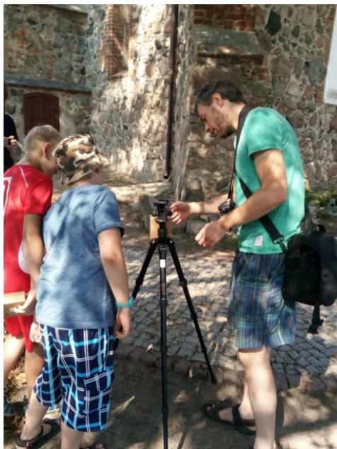
Uczestnicy tworzyli własne aparaty

Wydarzenie odbyło się dzięki owocnej współpracy Stowarzyszenia Kuźnia Inicjatyw Lokalnych w Lisewie z Fundacją 5 Medium oraz Fundacją Orange. W ramach bezpłatnych warsztatów uczestnicy pod okiem trenerów - Moniki i Pawła, przedstawicieli Fundacji 5 Medium z Lublina tworzyli własne aparaty fotograficzne z wykorzystaniem przedmiotów tj. pudełka kartonowe, czy puszki po napojach.