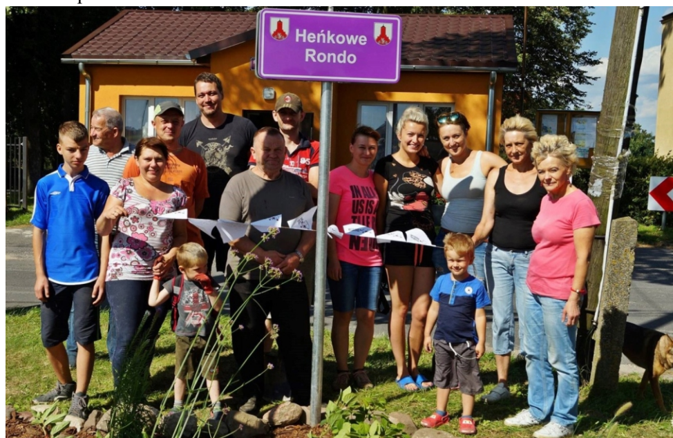
Mieszkańcy Wierzbowa uporządkowali teren koło świetlicy dzięki czemu powstało "Heńkowe Rondo"