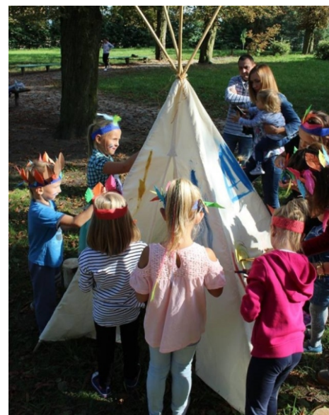
Podróż do wioski indiańskiej bardzo spodobała się dzieciom

16 września br. odbyło się kolejne spotkanie w parku zorganizowane przez Kuźnię Inicjatyw Lokalnych w Lisewie skierowane do rodzin z terenu Gminy Lisewo. Tym razem tematem przewodnim było jesienne grzybobranie. Na uczestników