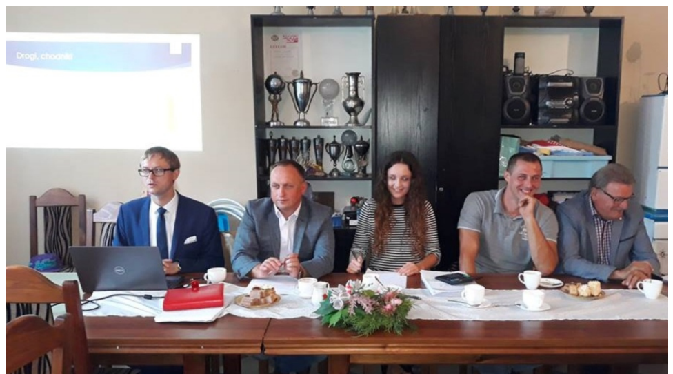
Zakończyły się już zebrania wiejskie w sprawie podziału Funduszu Sołeckiego na kolejny rok. Mieszkańcy dyskutowali na temat propozycji przedstawianych przez Sołtysów, ale sami także zgłaszali swoje pomysły