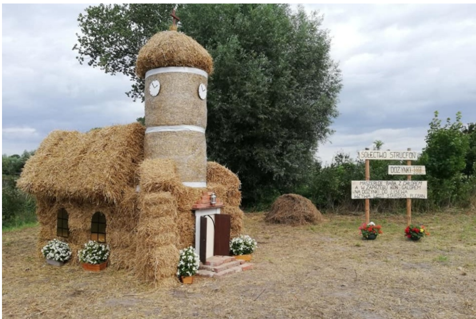
Po raz pierwszy w tym roku odbył się konkurs na „Najpiękniejszy Witacz w Gminie Lisewo” Na powyższym zdjęciu „witacz” Sołectwa Strucfoń

Po raz pierwszy w tym roku zorganizowaliśmy konkurs pn.