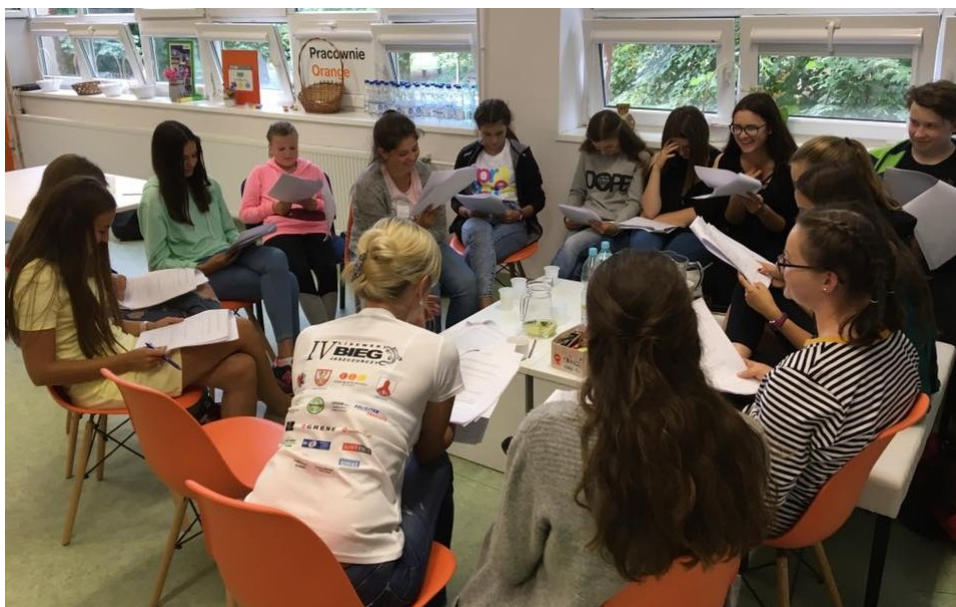
Grupa teatralna uczestniczy w cyklicznych spotkaniach, efekt będzie można zobaczyć już 8 listopada

Dziękujemy bardzo serdecznie osobom, które wspierają nasze działania podczas realizacji projektu oraz Ludowemu Klubowi Sportowemu Victoria w Lisewie