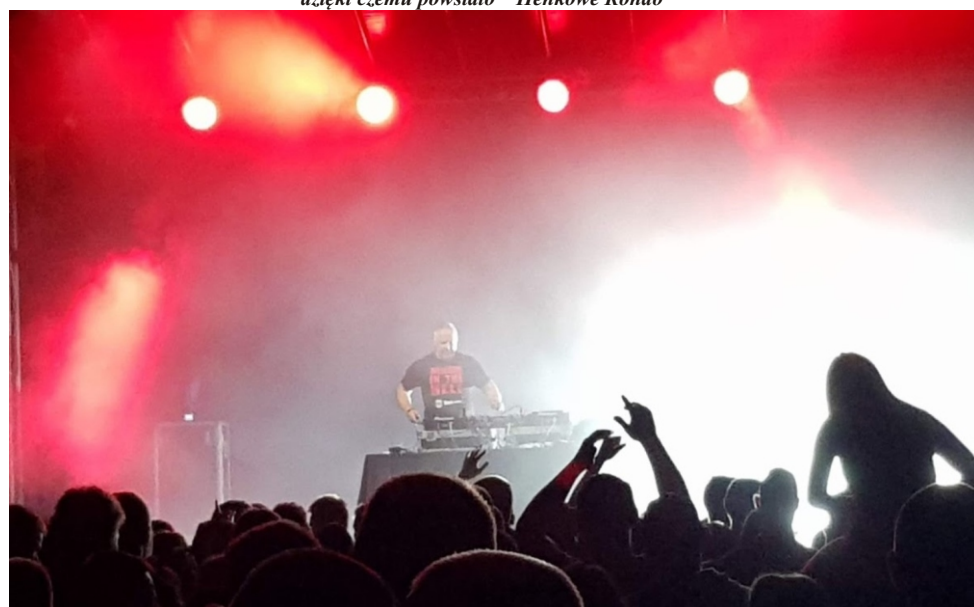
Po raz pierwszy w tym roku odbyła się Noc Dj'ów, a gwiazdą wieczoru był Dj Omen. Wydarzenie przyciągnęło tłumy.