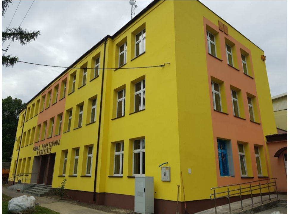
Szkoła w Krusinie dzięki termomodernizacji zyskała ładniejszy wygląd