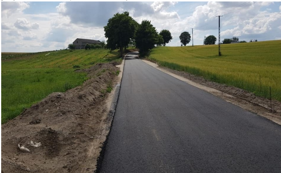
Zakończyły się prace na odcinku drogi łączącym dwie miejscowości Wierzbowo - Linowiec.