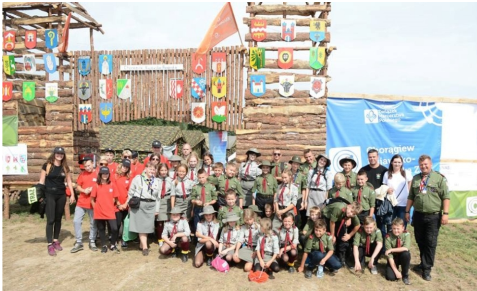
Młodzież z terenu gminy Lisewo wzięła udział w 5 - dniowej wycieczce na Mierzę Wiślaną