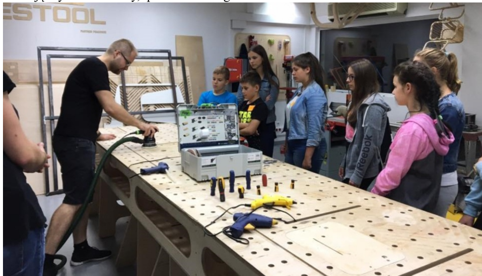
Podczas wizyty uczestnicy odbyli warsztat z zakresu projektowania 3D