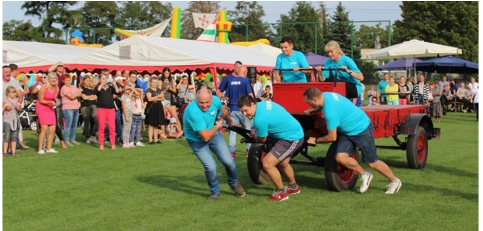
We wspaniałej atmosferze, zdrowej rywalizacji oraz z poczuciem humoru odbył się „Turniej Sołectw z Humorem”,