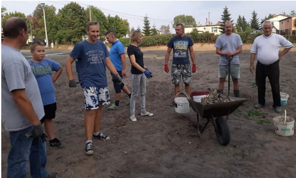
Mieszkańcy Lipienka wspólnie przygotowują działkę pod boisko

Za pozyskane środki zakupione zostanie także ogrodzenie. Boisko nie będzie duże, ponieważ nie ma takiej konieczności. Z pewnością jednak jest potrzebne, ponieważ dzieci bawią się na kartofliskach lub muszą dojeżdżać do