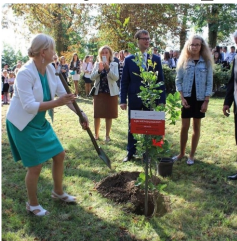
Posadzenie Dębu Niepodległości odbyło dla upamiętnienia 100-lecia Niepodległości Rzeczypospolitej Polskiej