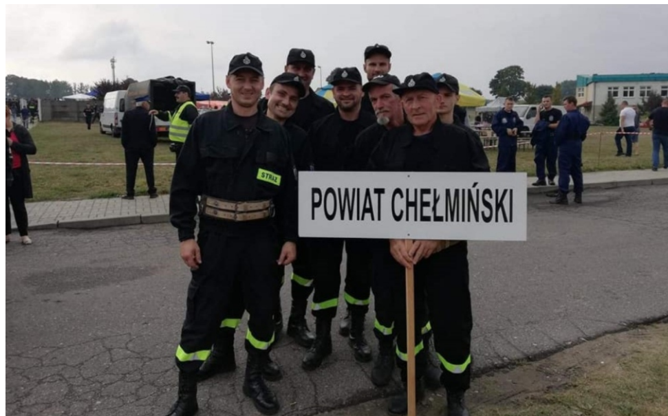
Powiat chełmiński reprezentowała OSP z maleńkiego Strucfonia, która najpierw okazała się najlepsza w gminie Lisewo, a następnie była najlepsza w powiecie chełmińskim

bojowe. Dodatkowo w ramach oddzielnej klasyfikacji przeprowadzono dla drużyn sprawdzian ze znajomości musztry strażackiej. Powiat chełmiński reprezentowała OSP z maleńkiego Strucfonia, która najpierw okazała się najlepsza w gminie Lisewo, a następnie była najlepsza w powiecie chełmińskim.