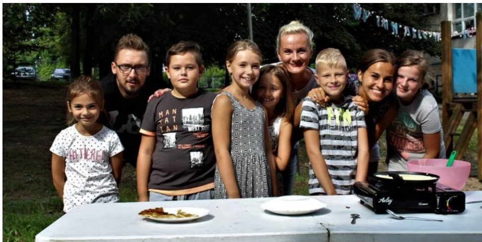
Piękna pogoda, park, dobre towarzystwo i znakomici kucharze...nie ma lepszego przepisu na naleśniki!