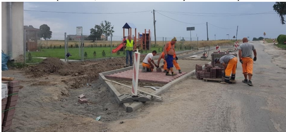
Prace drogowe w Linowcu

drogi łączącym dwie miejscowości Pomorskiego w kwocie 577 tys zł. Wierzbowo - Linowiec. Długość wyremontowanego odcinka wyniosła 1,643 km. Gmina pozyskała dofinansowanie na ten cel w kwocie 650 tys zł. a całkowita wartość zadania to ponad 1,3 mln zł.