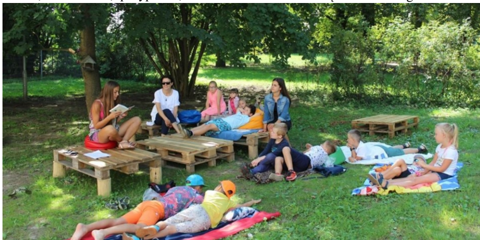
Wspólne czytanie na trawie i zajęcia relaksacyjne bardzo przypadły do gustu najmłodszemu gronu naszego społeczeństwa

młodymi aktorami z kółka teatralnego. Bardzo ciężko pracowaliśmy aby przygotować kabaret na dożynki oraz pisaliśmy scenariusz naszej sztuki, którą już niestety niebawem będziecie mogli Państwo