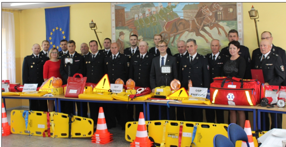
Pozyskanie sprzętu ratowniczego pozwoli na szybsze i skuteczniejsze podejmowanie działań ratowniczych, jak również wpłynie na bezpieczeństwo ratowników oraz osób poszkodowanych

"Współfinansowane ze środków - Funduszu Sprawiedliwości, którego dysponentem jest Minister Sprawiedliwości"