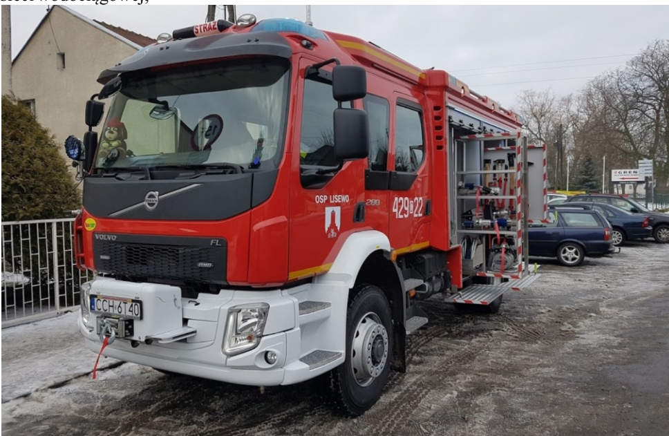
Zakup 4 samochodów ratowniczo-gaśniczych dla jednostek OSP z pewnością ułatwi pracę naszym strażakom