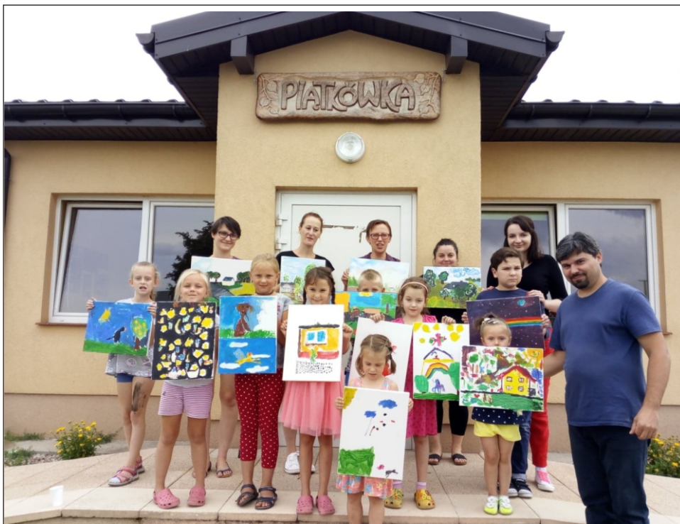
Uczestnicy zajęć z dumą prezentują swoje dzieła