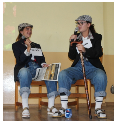
Grupa teatralna podczas występu na II Gminnym Dniu Seniora

„Plastelinowe kulejańce-wyklejańce”, na których to wyklejaliśmy różne, różniaste, różności. Wyobraźnia działała na