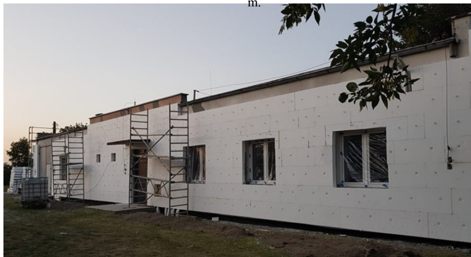
Świetlica w Kamlarkach została oddana do użytku 29 września br.