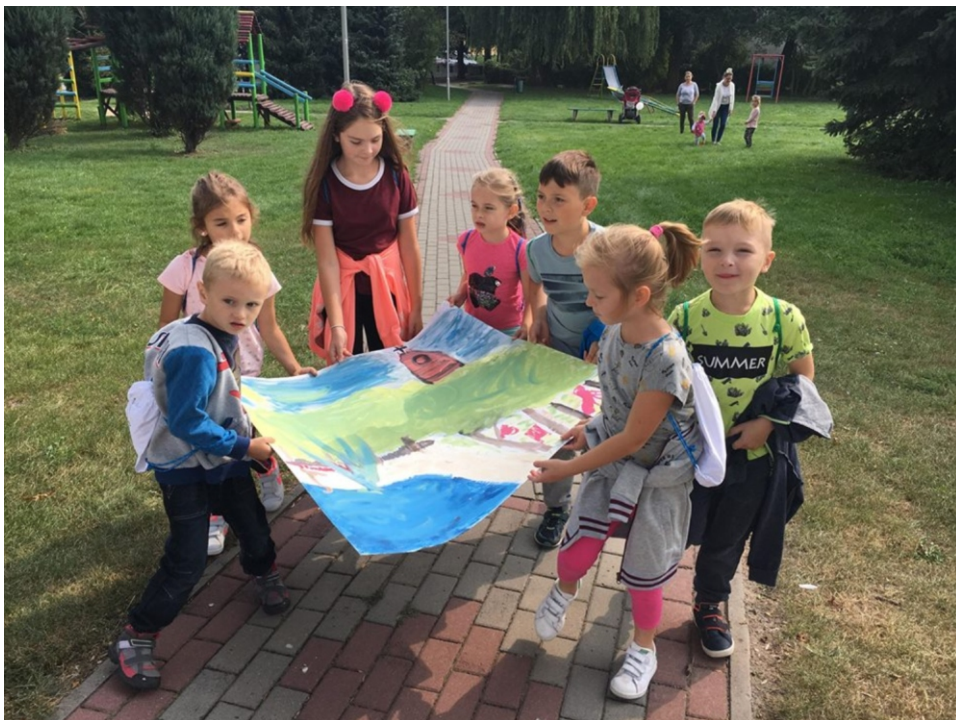
Podczas każdego 3-godzinnego warsztatów uczestnicy odbywali podróże w odległe zakątki świata