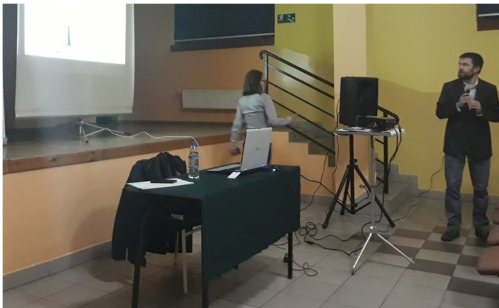
Dnia 24 września o godzinie 18:00 odbyło się spotkanie informujące w ramach programu „Czyste powietrze”

Program Priorytetowy Czyste Powietrze to możliwość uzyskania wsparcia finansowego przez osoby fizyczne, właścicieli domów jednorodzinnych na ocieplenie domu, wymianę okien czy na wymianę starego, wysoko-emisyjnego kotła grzewczego.