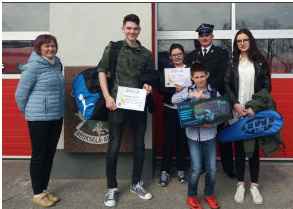
Laureaci powiatowego konkursu pożarniczego