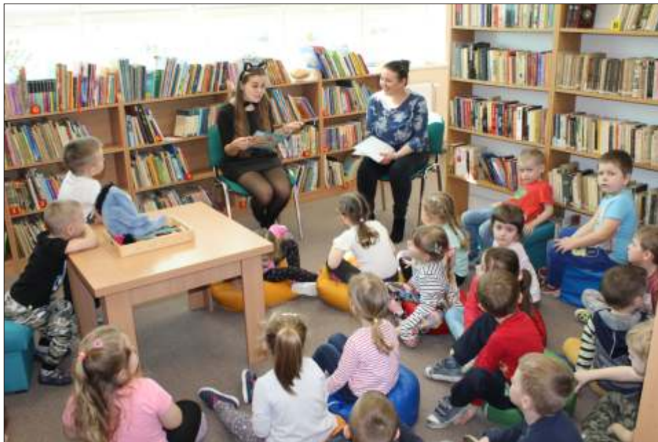
Dzieci z zainteresowaniem słuchali Koci Koci, która czytała bajki