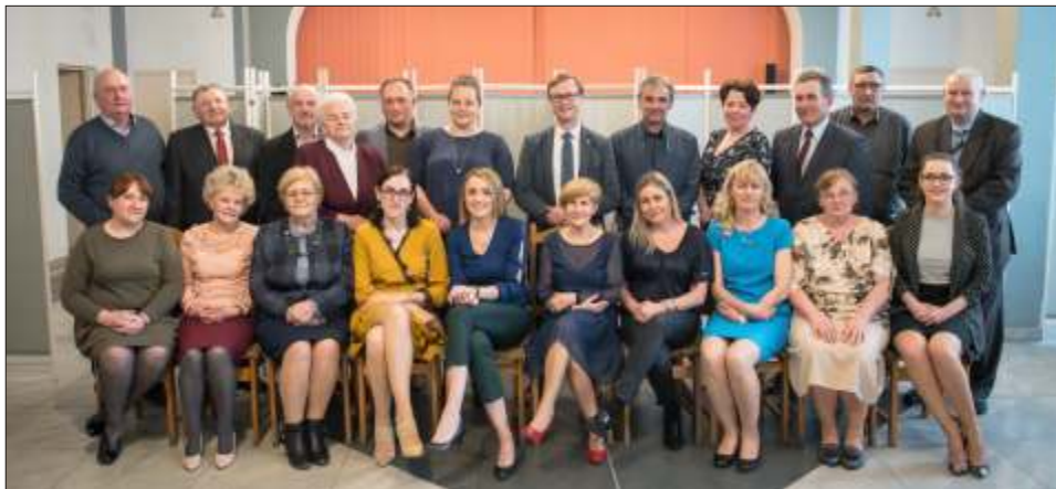
Już po raz trzeci sołtysi z terenu gminy Lisewo obchodzili Dzień Sołtysa