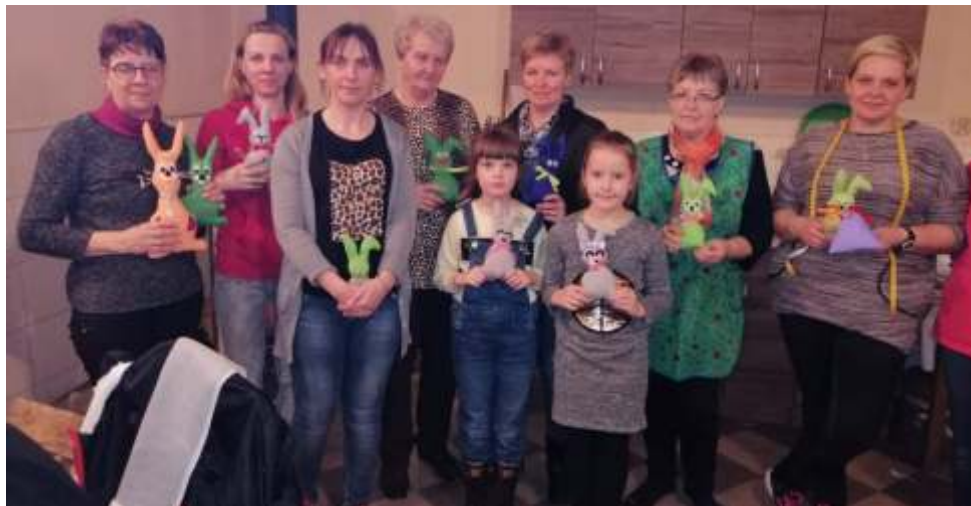
Lipieniaczy podczas warsztatów rękodzielniczych wykonywali ozdoby Wielkanocne