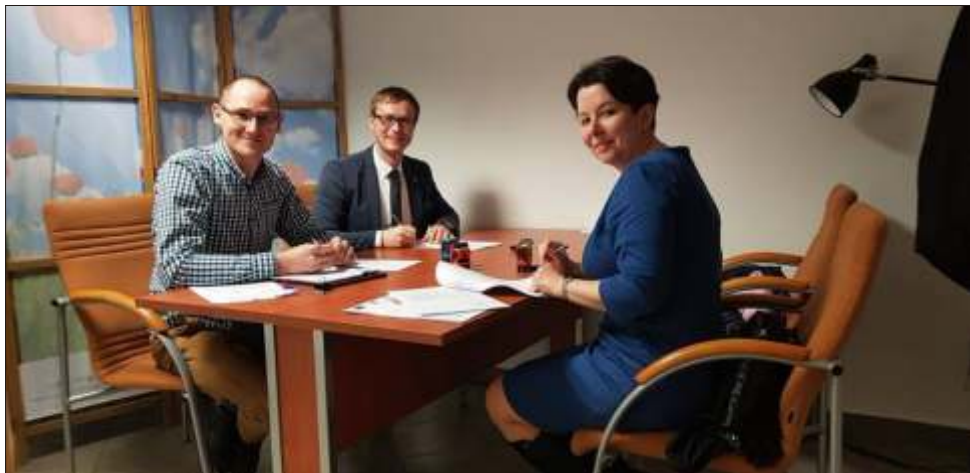
12 marca br. Wójt Gminy Lisewo wraz z Panią Skarbnik podpisał umowę na doposażenie sali widowiskowej