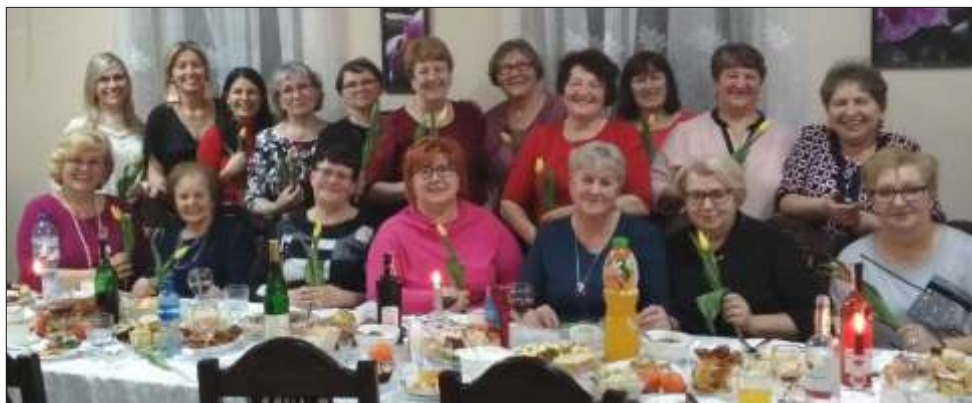
Panie z Kornatowa bardzo miło spędziły czas przy kawie i słodkościach

W Kornatowie 9 marca odbył się Dzień Kobiet, na który przybyło wiele Pań,