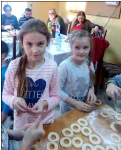
Dzieci z Malankowa zajęły się wypiekami chruścików i pączków