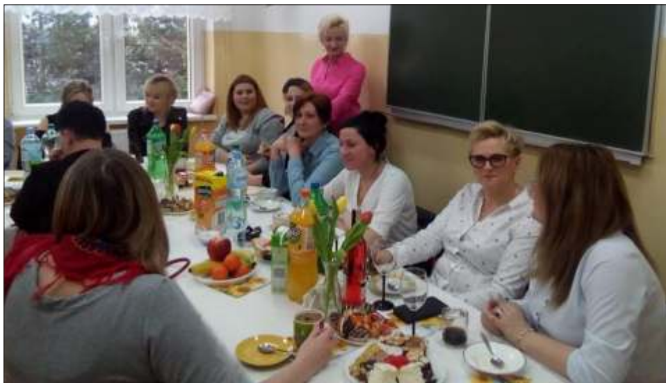
Panie z Krusina spędziły cudowne popołudnie w tym wyjątkowym dniu