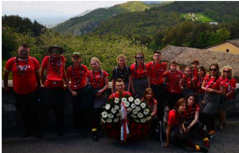
5 Wielopoziomowa Drużyna Harcerska z Lisewa na Monte Cassino.

Kolejny wyjazd (dla grupy starszej) został zorganizowany w ramach Harcerskiej Wyprawy Pamięci z okazji 75 rocznicy bitwy o Monte Cassino.