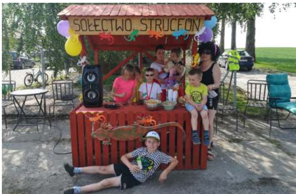
Pomimo upalnego dnia grupa wytrwale kibicowała sportowcom.

W ramach V edycji Biegu Jaszczurczego oraz promocji Gminy