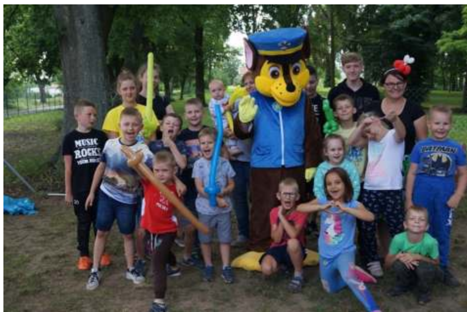
Dla dzieci z Wierzbowa nie ladą atrakcją była wizyta psa Chase z bajki Psi Patrol.