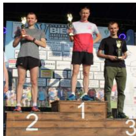
Zwycięzcy w kategorii OPEN - mężczyźni.