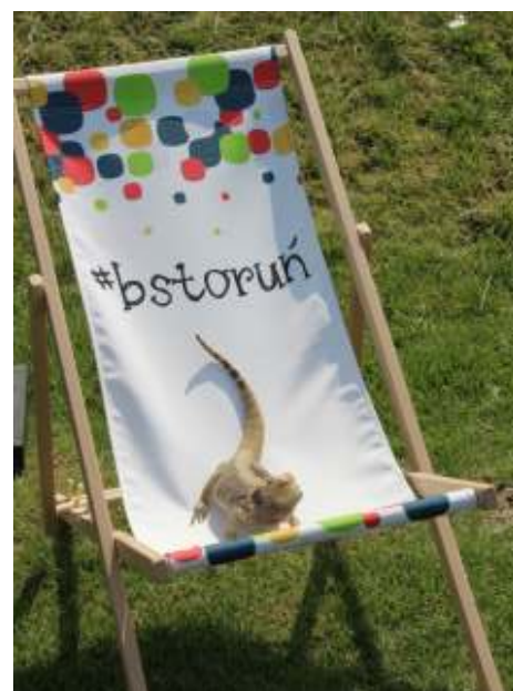
Jaszczurka - żywy symbol lisewskiego biegu.