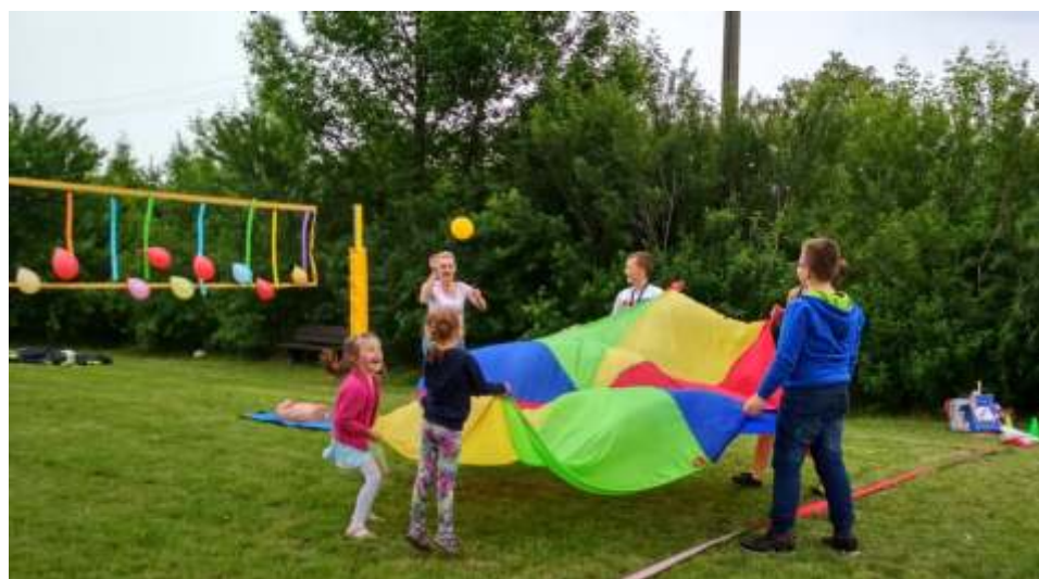
W Kornatowie dzieci bardzo uczestniczyły w zabawach z chustą animacyjną.