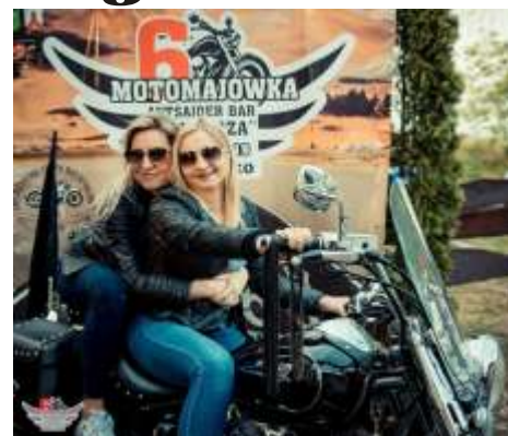
Podczas imprezy można było zrobić sobie pamiątkowe zdjęcie.

Został również rozegrany mecz siatkówki Samorządowcy - Motocykliści. Czas umiliły zespoły muzyczne: Pokój nr 3, Myasta i Heavy Metal Way. Organizatorzy serwowali pyszne kiełbaski z grilla. Za słodkie zaplecze odpowiadały Panie z Rady Sołectkiej wraz z Sołtysiem wsi Drzonowo, oferując pyszności przygotowane przez Pracownię Ciast i Tortów