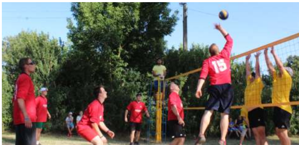
Mecz finałowy był bardzo zacięty i stał na wysokim poziomie.

Pacjenci przyjmowani są ze skierowaniem lekarskim.