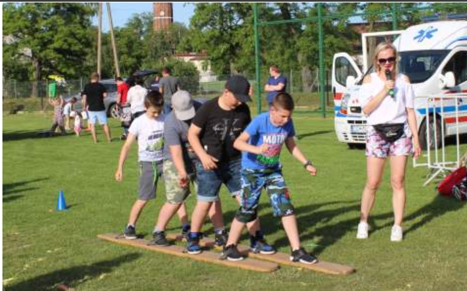
Dzieci bardzo chętnie brały udział w konkurencjach.

Niespodzianką był przyjazd Chełmżyńskiej Grupy Motocyklowej „Łoza”.