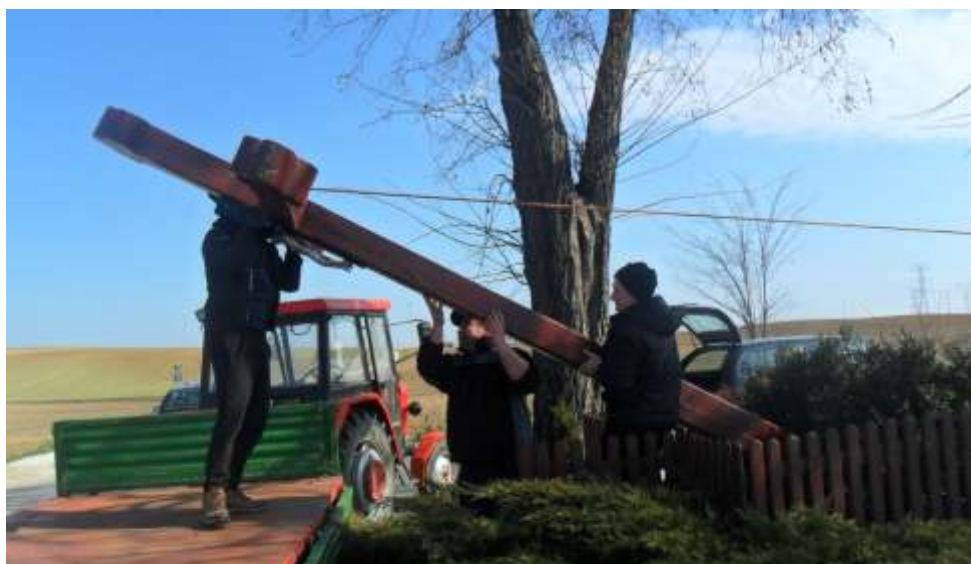
Wszyscy mieszkańcy dołożyli cegielkę do uporządkowania terenu przy krzyżu.