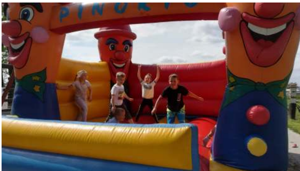
Bardzo dużo radości sprawił dzieciom "dmuchańce".

Również dla Mam z okazji ich święta czekało mnóstwo atrakcji. Został zorganizowany profesjonalny pokaz kosmetyków i biżuterii, a każda mama dostała od swoich pociech piękną, pachnącą różę. Dzięki hojności sponsorów wszyscy uczestnicy festynu mogli skorzystać z darmowego słodkiego poczęstunku oraz dań z grilla czy pysznej zupy. Czas umilił