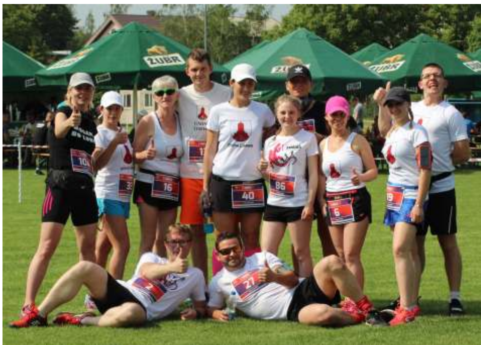
Aktywne Lisewo dzielnie reprezentowało naszą gminę.