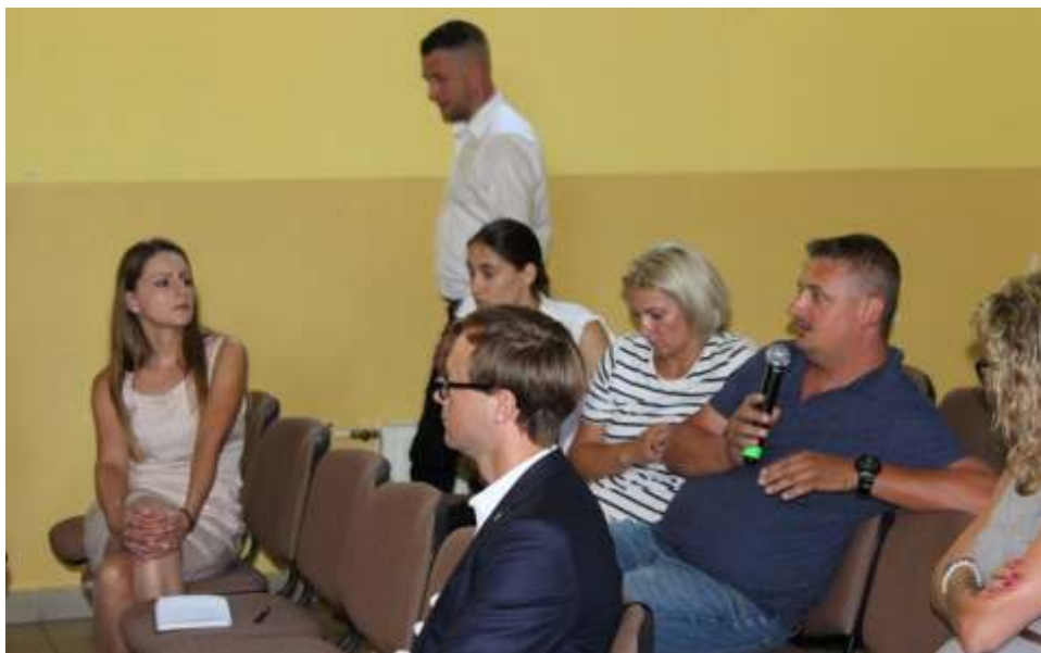
Spotkanie było znakomitą okazją do wymiany doświadczeń.

Spotkanie zwieńczyła prezentacja przedstawicieli firmy Samsung, którzy