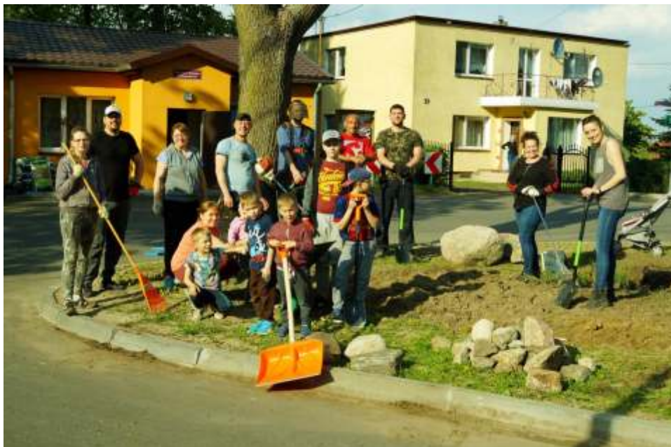
Po reaktywacji "Heńkowe Rondo" będzie jeszcze piękniejsze.

Podziękowania kieruję również do państwa Mastalarek za udostępnienie