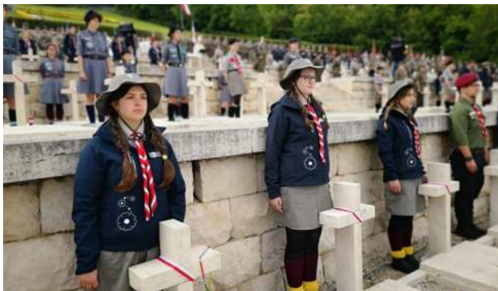
Harcerki i harcerze przez kilka godzin pełnili służbę na cmentarzu wojennym

2 maja harcerze rozpoczęli podróż z Warszawy do Sant Georgen w Austrii tam spotkali się z młodzieżą z różnych krajów, która przyjechała na uroczystości do Mauthausen i Gusen. Podczas wyprawy odbywały się uroczystości pod pomnikami upamiętniającymi polskie ofiary KL Mauthausen w Gusen, na cmentarzu w Ebensee, pod polskim pomnikiem przy sztolni Bergkristall oraz w centralnych uroczystościach na placu apelowym na terenie byłego obozu koncentracyjnego w Mauthausen.