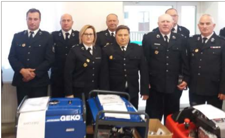
Jednostki OSP z terenu Gminy Lisewo wzbogaciły się o nowy sprzęt.

Wszystkim strażakom w dniu ich święta życzone bezpiecznych powrotów z akcji oraz szczęścia w życiu osobistym i zawodowym.