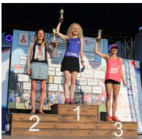
Zwycięzcy w kategorii OPEN - kobiety.