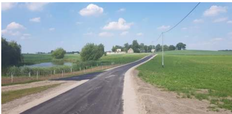
Prawie 1000 metrów nowej drogi zyskali mieszkańcy Lisewa.

Prace zakończyć się mają we wrześniu br. Na inwestycję pozyskano dofinansowanie w wysokości 190 606,00 zł pozostała część opłacona zostanie z budżetu Gminy Lisewo.