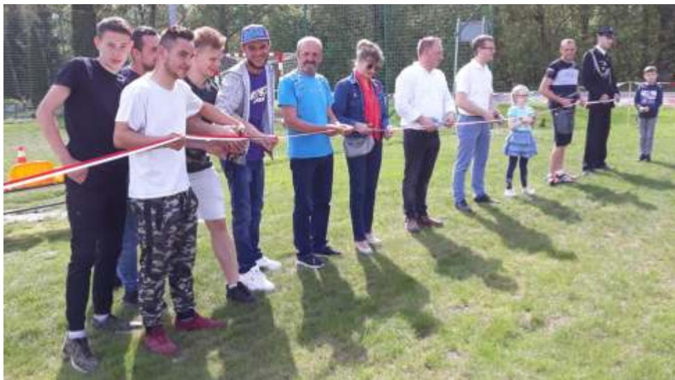
W otwarciu boiska brały udział nie tylko osoby dorosłe, ale też i dzieci

W dniach 11 i 12 maja br. mieszkańcy Wierzbowa w pocie czoła pracowali podczas akcji porządkowania wspólnej przestrzeni w centrum wsi. W efekcie dwudniowej pracy teren przy świetlicy został dokładnie uporządkowany, a „Heńkowe rondo” stało się jeszcze piękniejsze niż przed ubiegłoroczną przebudową centrum Wierzbowa.