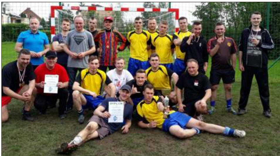
Druhowie z dumą prezentowali zdobyte trofea.