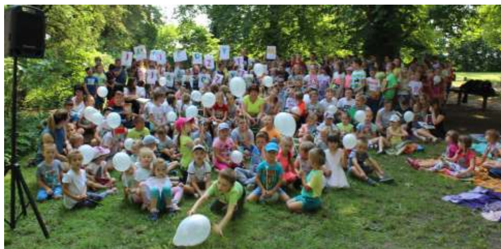
W ogólnopolskiej akcji „Jak nie czytam, jak czytam” w Lisewie wzięło udział około 146 osób.