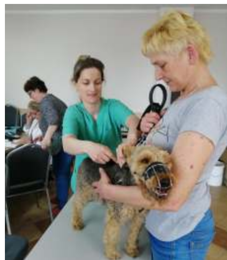
Podczas akcji oznakowano 59 psów.

Naszym zadaniem teraz jest głównie edukacja społeczeństwa w celu