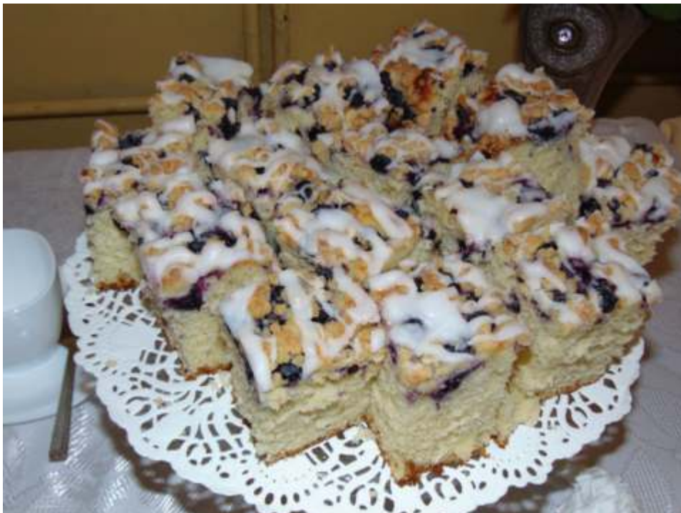
Jak co roku konkurs stał na wysokim poziomie.

Lubię działać społecznie już od samego początku załapałam kontakt z mieszkańcami oraz pomagam w miarę możliwości koleżanka ze stowarzyszenia "Kobiet Aktywnych Lipienianka ". Jeśli chodzi o werdykt - bardzo się zdziwiłam. Byłam mega zaskoczona tym bardziej, że początkowy zamysł miał być dodany o kompot ze świeżego rabarbaru z nutką cytryny