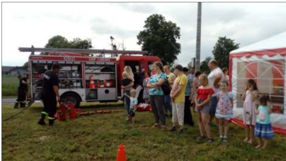
W Piątkowie dużym zainteresowaniem cieszył się pokaz strażacki.

16 czerwca piękny mieliśmy dzień w Wierzbowie - dzień naszych milusińskich, dzień uśmiechu i bez troskiej zabawy. Tego dnia nie mogło zabraknąć tego, co dzieci uwielbiają najbardziej - słodkich upominków, waty cukrowej, szaleństw z kolegami, baniek mydlanych, balonowych zwierzątek i bohaterów z bajek. To