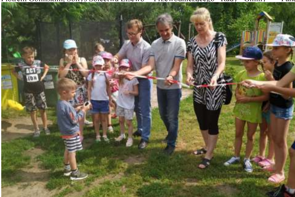
Otwarcie placu zabaw najwięcej radości sprawiło dzieciom.

Zadanie zrealizowane w ostatnim czasie przepięknie wpisuje się w tematykę wielkopostną i wielkanocną. Pomysł nawiązywał do zaangażowania w troskę o Krzyż z pokolenia na pokolenie, a który był zwykle odnawiany we własnym