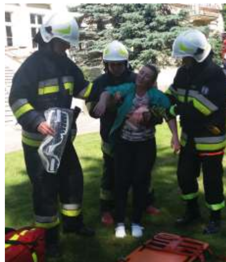
Ewakuacja pozostałych w domu osób nie sprawiła strażakom trudności.