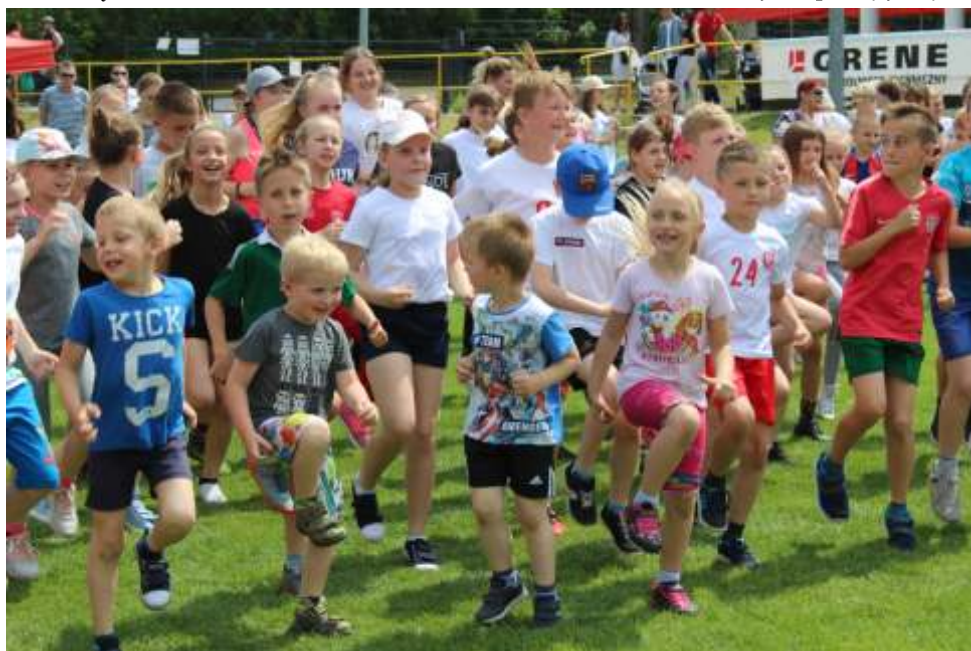
W biegach dzieci i młodzieży brało udział ponad 100 zawodników.