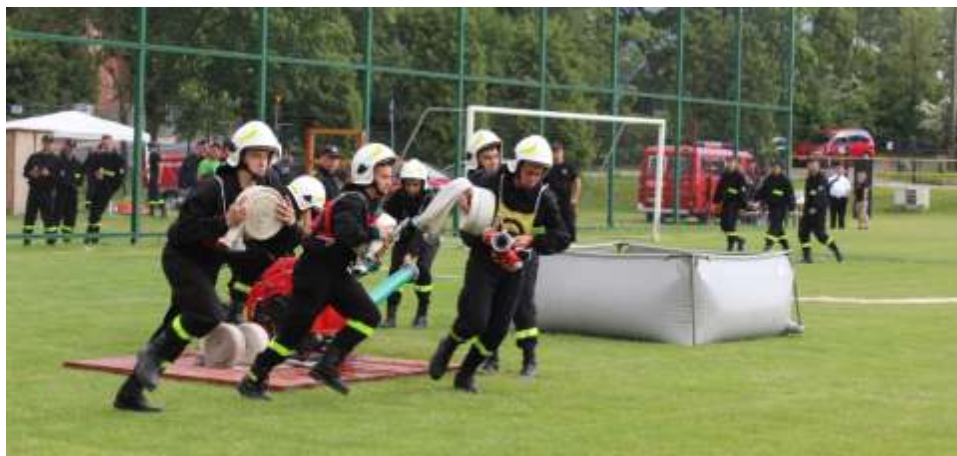
Rywalizacja była zacięta, a walka o podium trwała do samego końca.