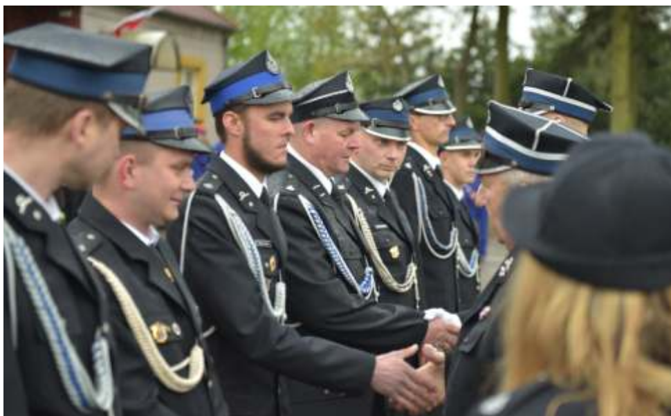
Najbardziej zasłużeni druhowie zostali odznaczeni.