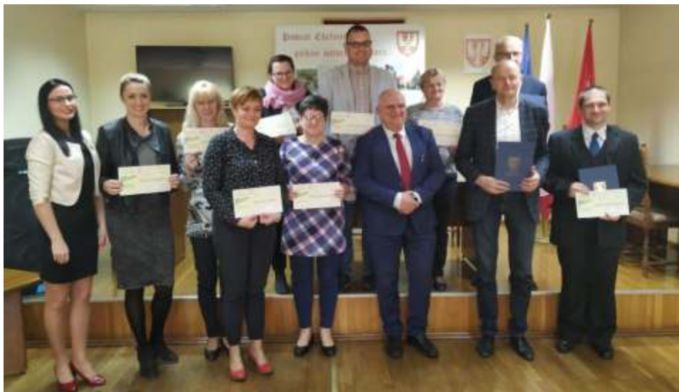
Laureaci Powiatowego Konkursu „Dziedzictwo kulturowe naszego sołectwa”.

Gratulujemy laureatom i czekamy na w realizację prac projektowych! efekty pracy zespołów zaangażowanych