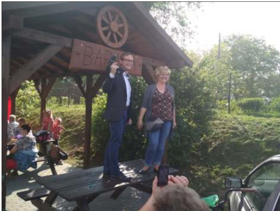
Nowa altana przyci ga wi cej osób do korzystania z boiska.

1 maja w dniu "Święta pracy" w Lipienku świętowano podwójnie, okazją było uroczyste otwarcie boiska, które