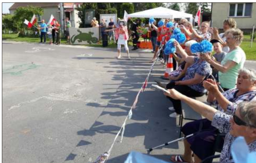
Mieszkańcy Lipienka stworzyli wspianą strefę kibica.