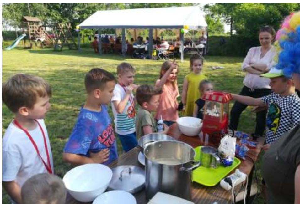
W Strucfoniu dla najmłodszych były gofry, popcorn, lody i słodycze.