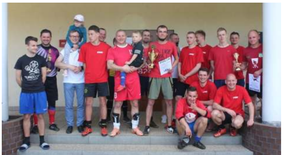
Drużyna Agrom-Lipienek nie kryła swojej radości z wygranej.