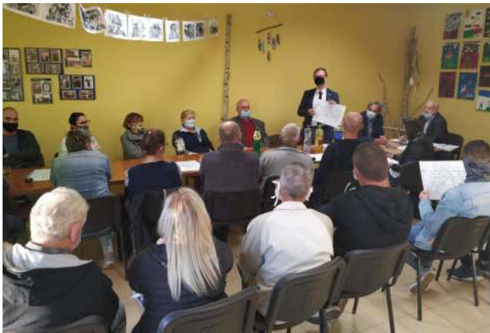
Uczestnicy zebrania w Piłkowie podczas dyskusji na temat ośrodka zdrowia

Mieszkańcy zaplanowali do realizacji również przedsięwzięcia: rozbudowę placów zabaw, urządzenie miejsc rekreacji i wypoczynku, rozbudowę oświetlenia, doposażenie i remonty wietlic wiejskich, dofinansowanie zakupu sprzętu dla jednostek OSP, zakup nasadzeń, doposażenie boisk sportowych. W kolejnym roku organizowane będą liczne warsztaty i wyjazdy edukacyjne, czy te działania pobudzające aktywność obywatelską w formie działań cyklicznych, spotkań i imprez tematycznych. Dofinansowanie w formie dotacji otrzymają poza tym liczne lokalne stowarzyszenia. Tradycyjnie zabezpieczono również rodki na funkcjonowanie wietlic wiejskich. Niemalże wszystkie sołectwa zabezpieczyły rodki na dofinansowanie rozbudowy GOZ w Lisewie w najbliższej