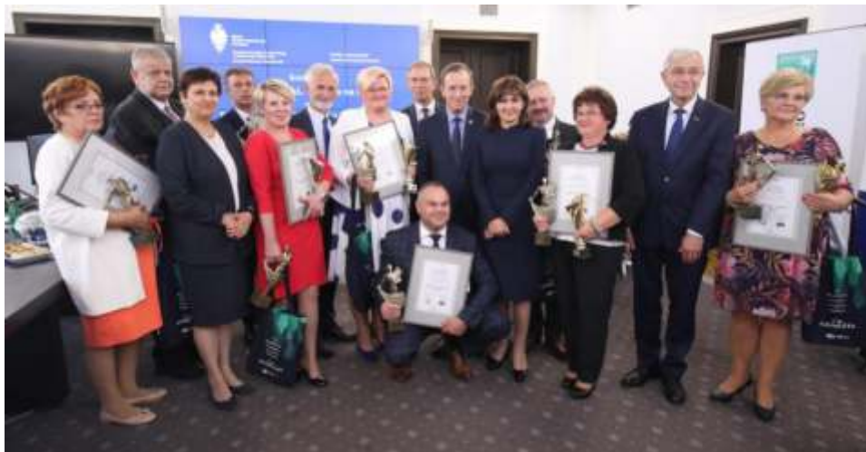
Laureaci konkursu oraz gospodarze i jego organizatorzy