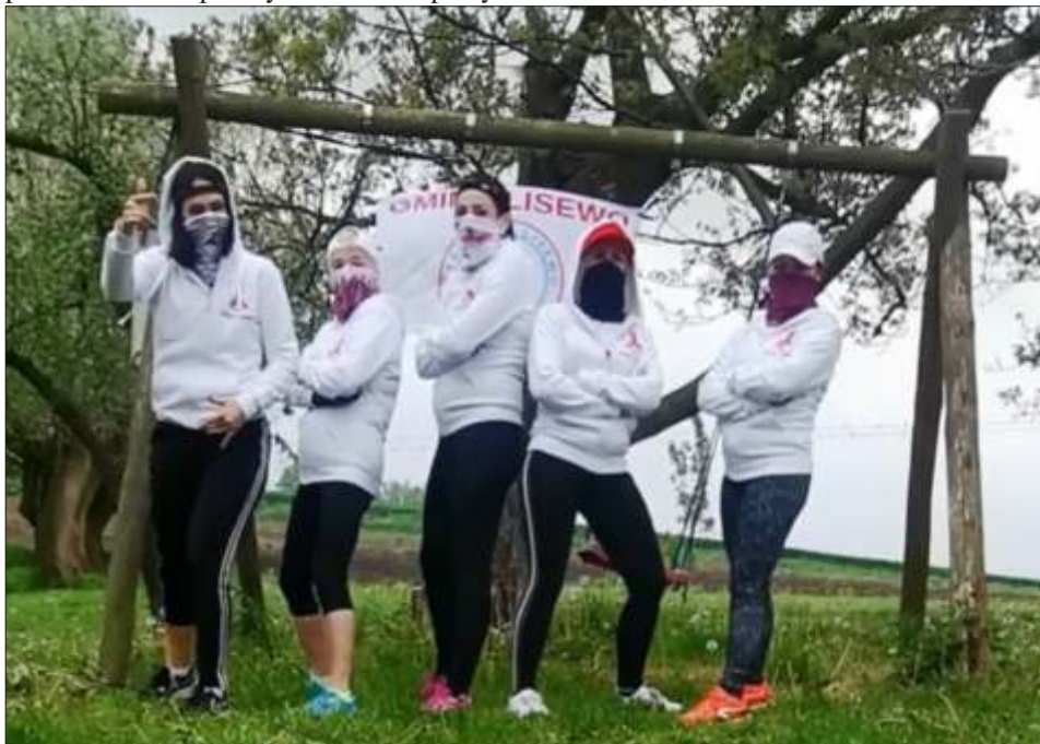
Grupa Aktywne Lisewo podczas swojego challeng'u

Nie chcieli my zaprzepa ci koncepcji, które wówczas powstały, dlatego postanowili my zmodyfikowa form . Poprosili my mieszka ców by nagrali krótkie hasło: "30 lat samorz dno ci w Polsce! Gmina Lisewo - moja mała ojczyzna". Z nadesłanych nagra chcieli my stworzy filmik i opublikowa go w internecie. Zastanawiali my si jaki b dzie odbiór tego pomysłu przez mieszka ców wi c zmienili my nieco form bazuj c na popularnym wówczas "Hot16challenge2".