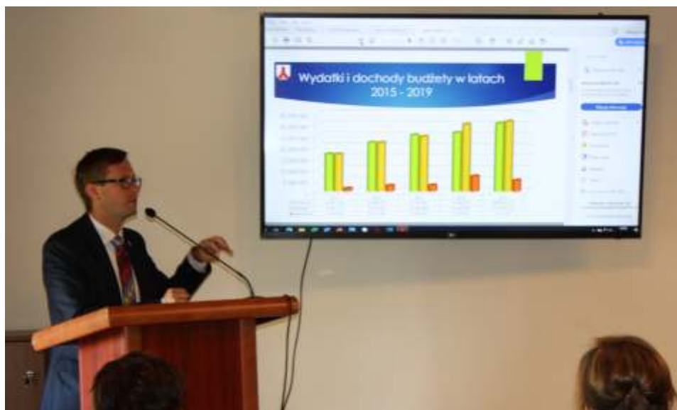
Wójt Gminy Lisewo przedstawił również raport o stanie gminy za 2019 rok.