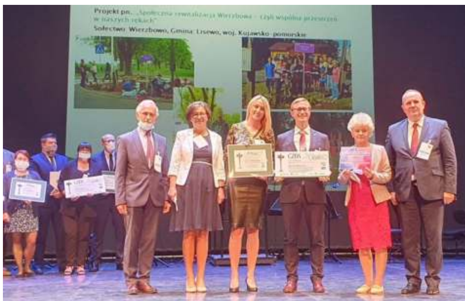
Reprezentacja Gminy Lisewo z organizatorami konkursu i fundatorami nagród

Kochani dziękujemy za trzymanie kciuków, wsparcie i kibicowanie wszystkim znajomym, przyjaciółom i mieszkańcom, dziękujemy jak Małżeństwo Wielkie Sołectwo, mamy mega motywację do dalszego działania.