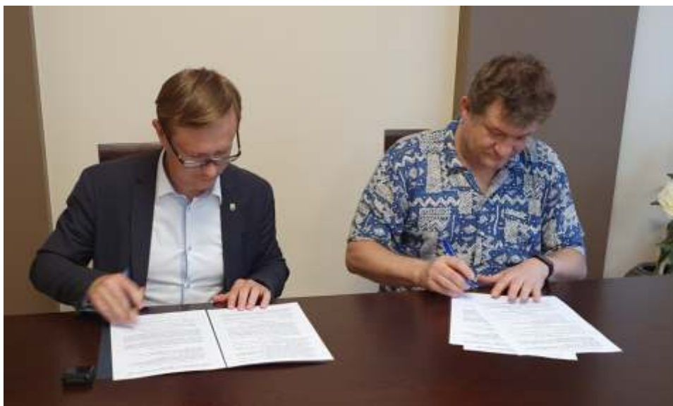
Moment podpisania umowy w gabinecie Wójta

300 - 400 tys. zł zostanie przeznaczony na wyposażenie ośrodka. Gminie udało się pozyskać 0,5 mln zł z Funduszu Inwestycji Samorządowych. Do zadania dołączono również społeczeństwa, które z funduszu społecznego wyłożyło konkretne sumy, na inwestycję zostanie przeznaczony blisko 140 tys. zł. N.S.