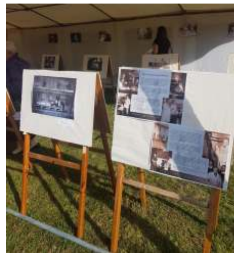
Wystawa cieszyła si du ym zainteresowaniem

Jest nam niezmiernie miło, e starania te zostały zauwa one i docenione, czego dowodem jest otrzymane wyróż nienie w kategorii „Orły Polskiego Rolnictwa” wr czone podczas uroczystej