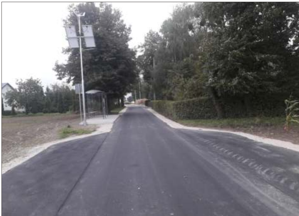
Nowa nawierzchnia drogi w Pi tkowie

Fotowoltaika i solary słu y b d mi dzy innymi do podgrzewania wody. Koszt inwestycji realizowanego ramach projektu "Budowa instalacji OZE w Gminie Lisewo II" wyniósł 944 512,20 zł z czego dofinansowanie w wysoko ci 472 256,10 zł pochodziło ze rodków Regionalnego Programu Operacyjnego Województwa Kujawsko-Pomorskiego 2014-2020.