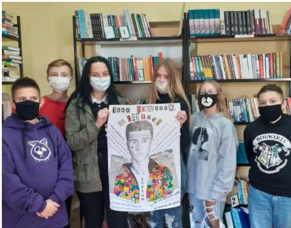
Uczniowie z plakatem promującym akcję