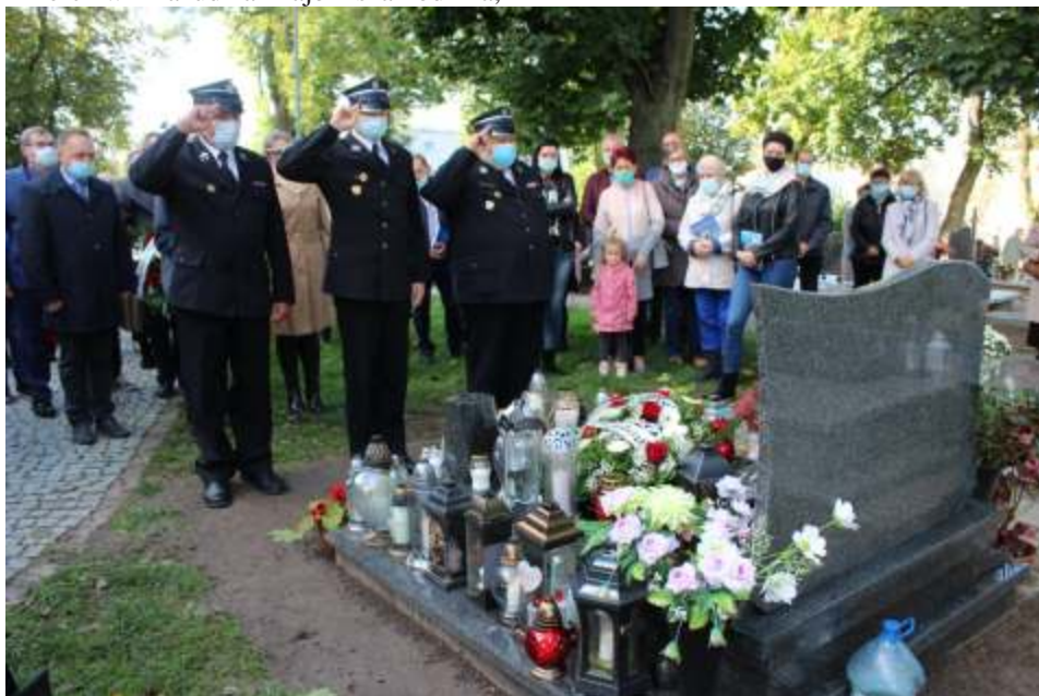
Złożenie wieńca przez delegację strażaków z Gminy Lisewo