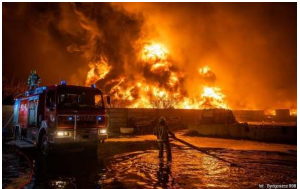
Druhowie OSP podczas działań gaśniczych

Strażacy zgodnie mówią, że to nie była prosta akcja gaśnicza - pożar objął cały teren około 1,5 ha. Akcja gaśnicza utrudniał gęsty trójcy dym palonej gumy. Sobotni wpis druhow z OSP Lisewo: „Po 36 godzinach walki z pożarem wracamy do bazy. Okrutnie zmęczeni, ale bez żadnych strat. Niestety ta walka jeszcze trwa. Na