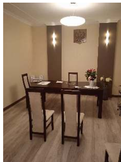
Tak prezentuje się sala lubów w lisewskim urzędzie

Oczywiście zarówno narzeczeni, jak i świadkowie muszą być pełnoletni. Wszyscy w dniu lubu muszą mieć przy sobie dokumenty to samo dotyczy.