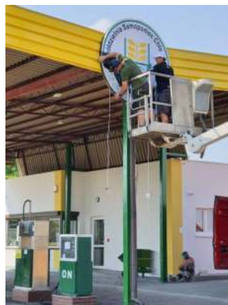
Modernizacja stacji paliw

Prezes wskazuje znaczenie pozyskanych w roku 2020 rodków zewn trznych na ró ne działalno ci GS-u. To nie tylko pieni dze unijne z Urz du Marszałkowskiego i Toru skiej Agencji Rozwoju Regionalnego, ale równie