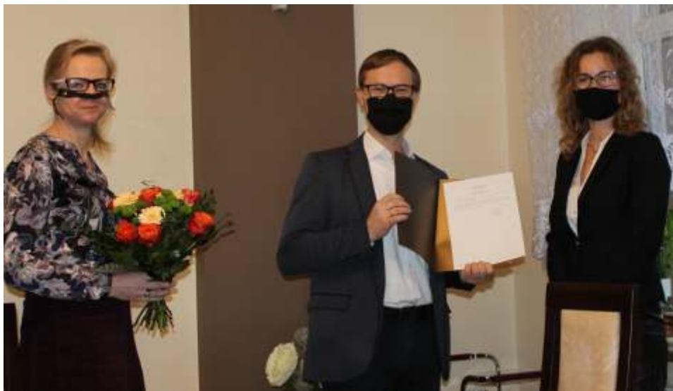
Uroczyste przekazanie obowiązków odbyło się na sali lubów