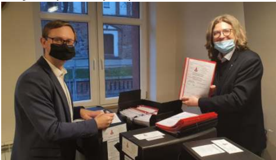
Wójt nie kryje zadowolenia z realizacji kolejnego etapu zadania