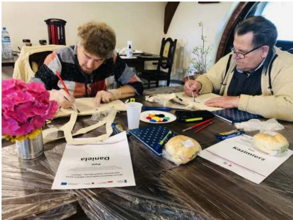
Projekt pokazał jak potrzebne w naszej gminie są działania skierowane do seniorów

d) korzystających z POP (indywidualnie lub jako rodzina), o ile zakres wsparcia