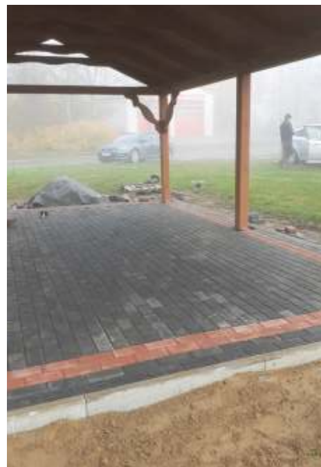
Utwardzenie terenu pod altan w sołectwie Lipienko

Galeria dowodów zebranych w ramach wierzbowskiej akcji